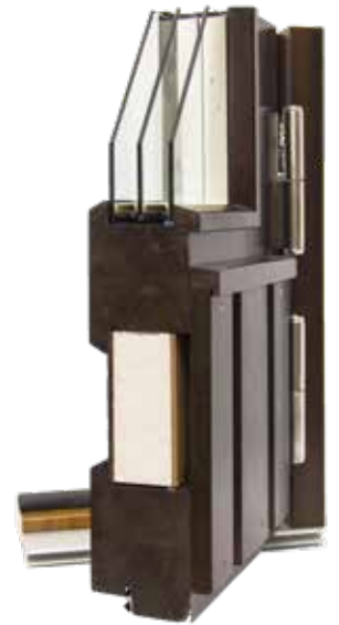
Parvekeovi EPO 70mm

Sormijatketuista lamelleista liimaamalla valmistettu kehäpuurunko on markkinoiden vahvin. Tuulettuva alumiiniverhous kiinnitetty kestävin alumiinikiinnikkein. 3K-lasitus ja EPS-eriste. Kynnyksessä kulutusta kestävä alumiininen päällilista ja kynnyksen etulistassa kätevä snap-in-kita kynnykspellin kiinnitykseen.