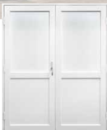
EPO-A ovet pariovina