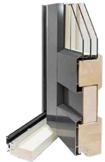
Parvekeovi REPO 80mm

Sormijatketuista lamelleista liimaamalla valmistettu kehäpuurunko on markkinoiden vahvin. Tuulettuva alumiiniverhous kiinnitetty kestävin alumiinikiinnikkein. 3K-lasitus ja EPS-eriste. Kynnyksessä kuullotettua koivua.