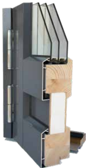
Parvekeovi EPO-A 80mm

Säänkestävä HDF-levy ja alumiinijäykiste molemmin puolin. Tuplarunkorakenne ja EPS-eristys. Kynnyksessä kulutusta kestävä alumiininen päällilista ja kynnyksen etulistassa kätevä snap-in-kita kynnykspellin kiinnitykseen. 90 mm lämpöovirakenteesta saatavilla myös ääneneristys- ja paloeristysrakenteet.