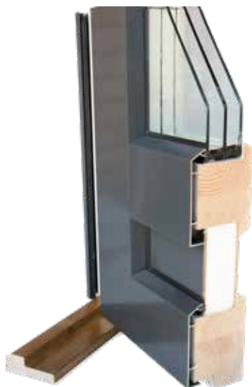
Parvekeovi SEPO 80mm

Sormijatketuista lamelleista liimaamalla valmistettu kehäpuurunko on markkinoiden vahvin. Paneeli on pintakäsitelty ennen kokoonpanoa. 3K-lasitus ja EPS-eriste. Kynnyksessä kulutusta kestävä alumiininen päällilista ja kynnyksen etulistassa kätevä snap-in-kita kynnykspellin kiinnitykseen.