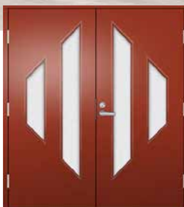
117 ovet pariovina