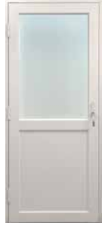
EPO-A 41 dB

Lammin ääneneristysovista löydät suorituskykyisen testatun oven meluntorjuntaan äänen lähteestä riippumatta. Nämäkin mallit valmistetaan tarpeidesi mukaisesti – koko, väri ja varusteet valintasi mukaan. Ääneneristysovia on saatavana myös alumiiniverhottuina terassi- ja parvekeovina. Kun haluat pitää äänet asunnon ulkopuolella ja lämmön sisällä, on Lammin ovi oikea valinta.