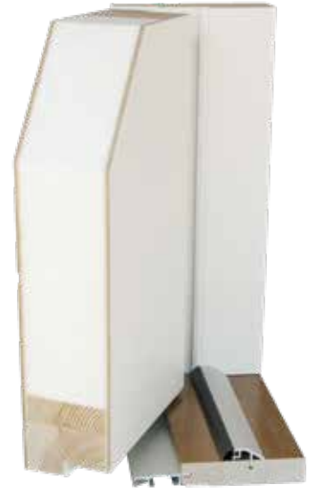
Lämpöulko-ovi PLUS 90mm

Säänkestävä HDF-levy ja alumiinijäykiste molemmin puolin. Tuplarunkorakenne ja EPS-eristys. Kynnyksessä kulutusta kestävä alumiininen päällilista ja kynnyksen etulistassa kätevä snap-in-kita kynnykspellin kiinnitykseen.