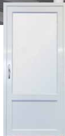
SEPO-A sis. aukeava